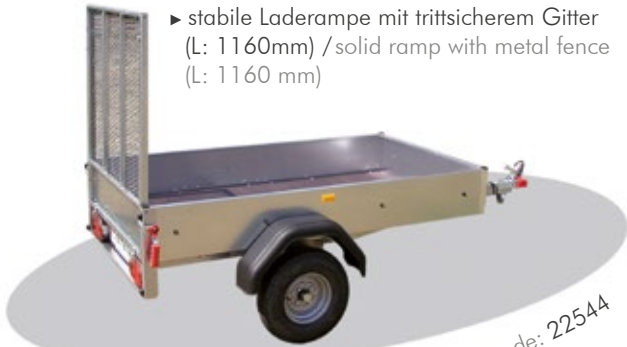
Basismodell / basic model Art.-Nr. / code: 22544