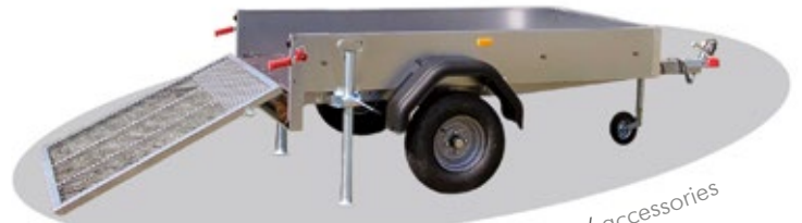
Zubehör / accessories